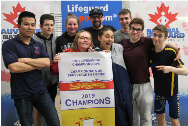
Les champions du Nouveau-Brunswick, Centre aquatique des Jeux du Canada, posent avec leur bannière aux Championnats de sauvetage en piscine du Nouveau-Brunswick 2019.

Veillez vous joindre à nous le 12 août 2019 à la plage Parlee pour les 33e Championnats de sauvetage sur plage continentale du Nouveau-Brunswick. Les trousse d'inscription sont disponibles sur le site Web de la Société, au www.sauvetagenb.ca .